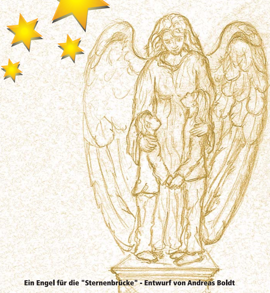
Ein Engel für die "Sternenbrücke" - Entwurf von Andreas Boldt